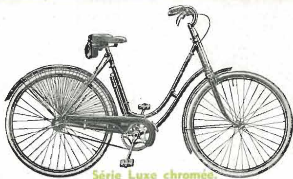
Série Luxe chromées.

TYPE D2. — Dame route luxe. — Cadre brasé à double col de cygne de 52 % (roues 650×35) ou de 55 (roues 700×35). — Jantes acier chromées. — Rayons cadmiés. — Roue libre. — Garde-boue acier. — Guidon chromé genre anglais n° 5, relevé n° 6 ou trial n° 7. — Poignées buffe. — Selle à coussins. — Sacoche de selle. — Pompe. — 2 freins Terrot chromés à câbles avec attaches brasées. — Pédales chromées à blocs caoutchouc. — Chaîne Brampton « Superb ». — Garde-chaîne. — Filets garde-jupe. — Multiplications roues de 650×35 : 4,27 ou 5,22 ; roues de 700×35 : 5,05 ou 4,60. — Email noir filets argent. Prix. . . . . 685 » TYPE DE. — Ecclésiastique. — Mêmes spécifications que ci-dessus, mais cadre renforcé simple col de cygne. — Selle grand luxe. . . . . 685 » TYPE DL. — Mêmes spécifications que D2, mais 2 freins anglais chromés. 685 » TYPE DG. — Dame confort luxe. — Mêmes spécifications que D2, mais équipement confort. — Selle confort. — Pneus ballon 650×50. . . . . 720 »